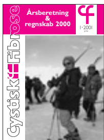
Forside: CF-Vinterlejr, februar 2001