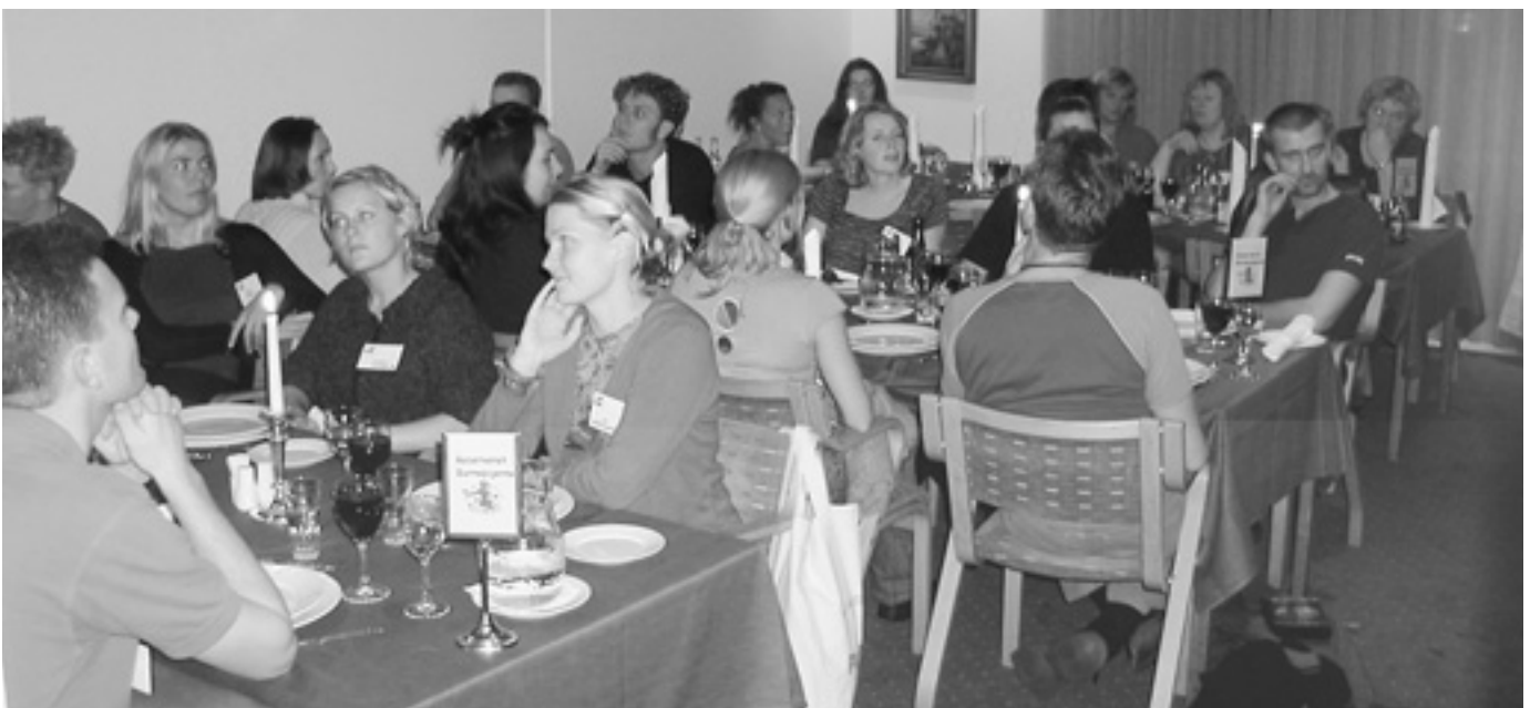
CF-familie- kursus 2000: "Barnepiger m/k" i spise- pausen lørdag aften

Vi sender en varm tak til de mange, som støttede CF-bekæmpelsen i 2000. Samtidig tillader vi os at gøre opmærksom på, at vi i den kommende tid i tiltagende grad får brug for økonomisk hjælp til vort arbejde, idet vor andel af Tips/Lotto-midlerne som omtalt bliver beskåret, da flere organisationer skal dele disse midler. I det kommende år vil vi således af Tips/Lottomidlerne miste ca. 100.000 kr. til vore kursus- og lejrformål og blive reduceret med yderligere 60.000 kr. til CF-foreningens øvrige arbejdsopgaver. Vi håber, at mange vil hjælpe os med at vende denne udvikling.