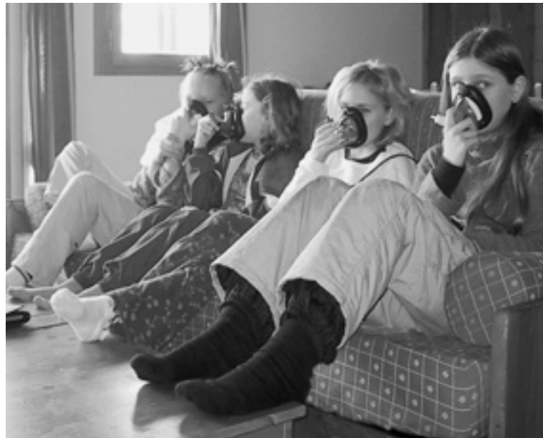
Vinterlejr - peppermask- behandling

Vi tillader os også at gøre opmærksom på, at vi har behov for både medlemskontingent og bidrag. Vore tilskud fra Tips/Lottomidlerne er nemlig betingede af, at vi både har et højt antal kontin-